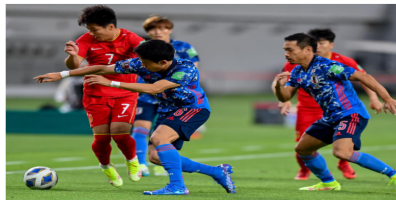
2021年9月7日, 中国队球员武磊(左一)与日本队球员远藤航(左二)在比赛中拼抢。