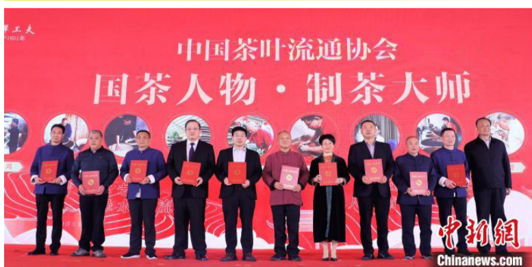
颁发“国茶人物·制茶大师”证书。