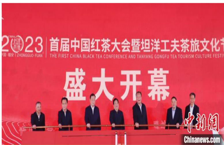
2023首届中国红茶大会暨坦洋工夫茶旅文化节开幕式现场。