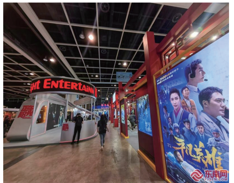
香港国际影视展现场