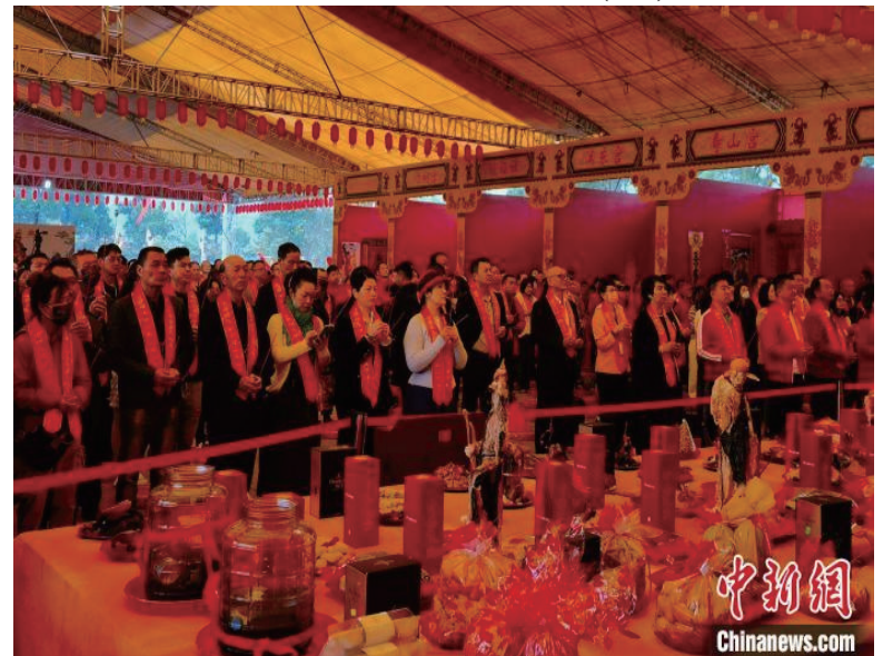
逾千名海内外信众共同拜谒广泽尊王。

据悉,本次活动为期3天,还举行“共叙凤山缘,同心促融合”台湾嘉宾代表会见座谈会、成功故里·溯源之旅及南音、高甲戏、传统武术等非遗展演等多项活动。(完)