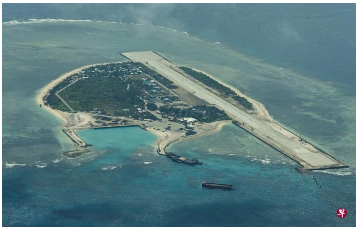
菲律宾实际控制派格阿萨岛，岛上有军用机场和码头，中国大陆、台湾和越南也宣称拥有此岛主权。