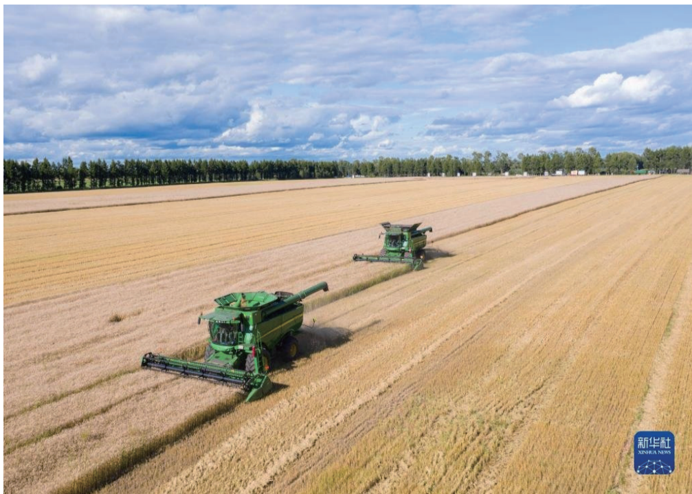
联合收割机在黑龙江北大荒集团红星农场有限公司田间收获小麦（2022年8月10日摄，无人机照片）。

东风浩荡满眼春，万里征途惟奋进。让我们更加紧密地团结在以习近平同志为核心的党中央周围，全面贯彻习近平新时代中国特色社会主义思想，勠力同心加油干，风雨无阻向前进，为全面建设社会主义现代化国家、全面推进中华民族伟大复兴而不懈奋斗！