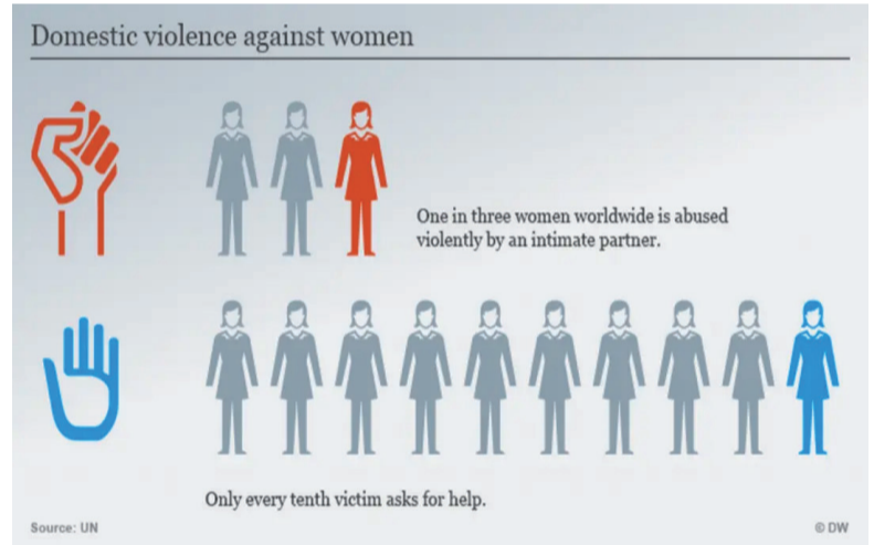
图/据德国媒体DW报道：德国平均每3天有1名女性死于伴侣之手。