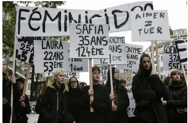
图/2019年11月法国反对“杀害女性”游行中的抗议者，标牌上是2019年的受害者姓名、年龄和案件序号。