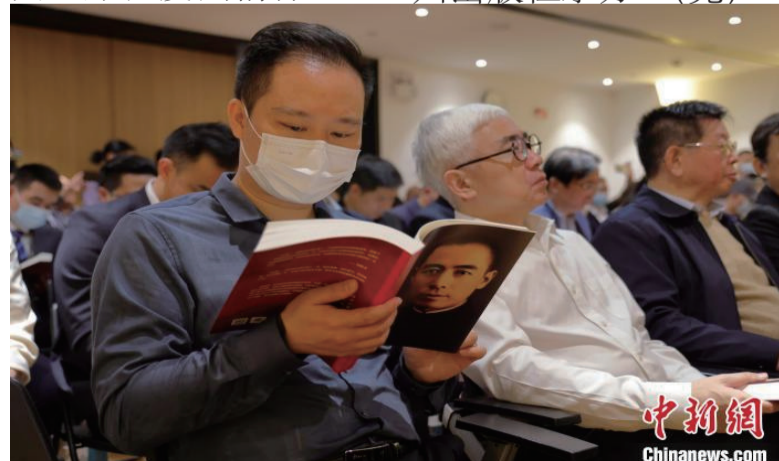
《信仰——周恩来岭南纪事》新书首发 暨分享活动现场