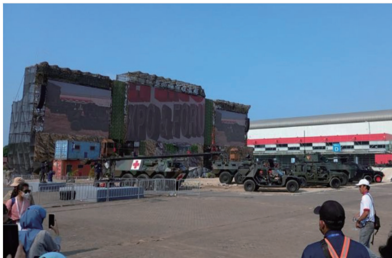
当地制造的装甲车和战术车在雅加达国际博览会现场展示。