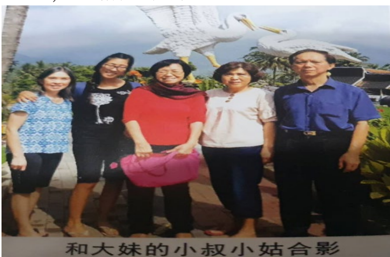
和大妹的小叔小姑合影