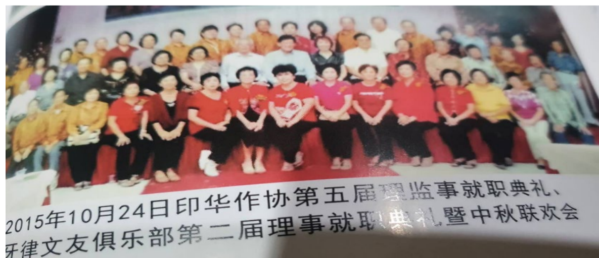
2015年10月24日印华作协第五届理监事就职典礼、牙律文友俱乐部第二届理事就职典礼暨中秋联欢会