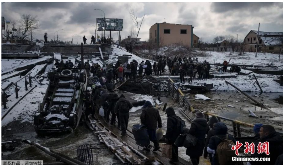
图为当地时间2022年3月8日，乌克兰基辅郊区，当地民众撤离伊尔平时，穿过一条在废墟上临时搭建的道路。