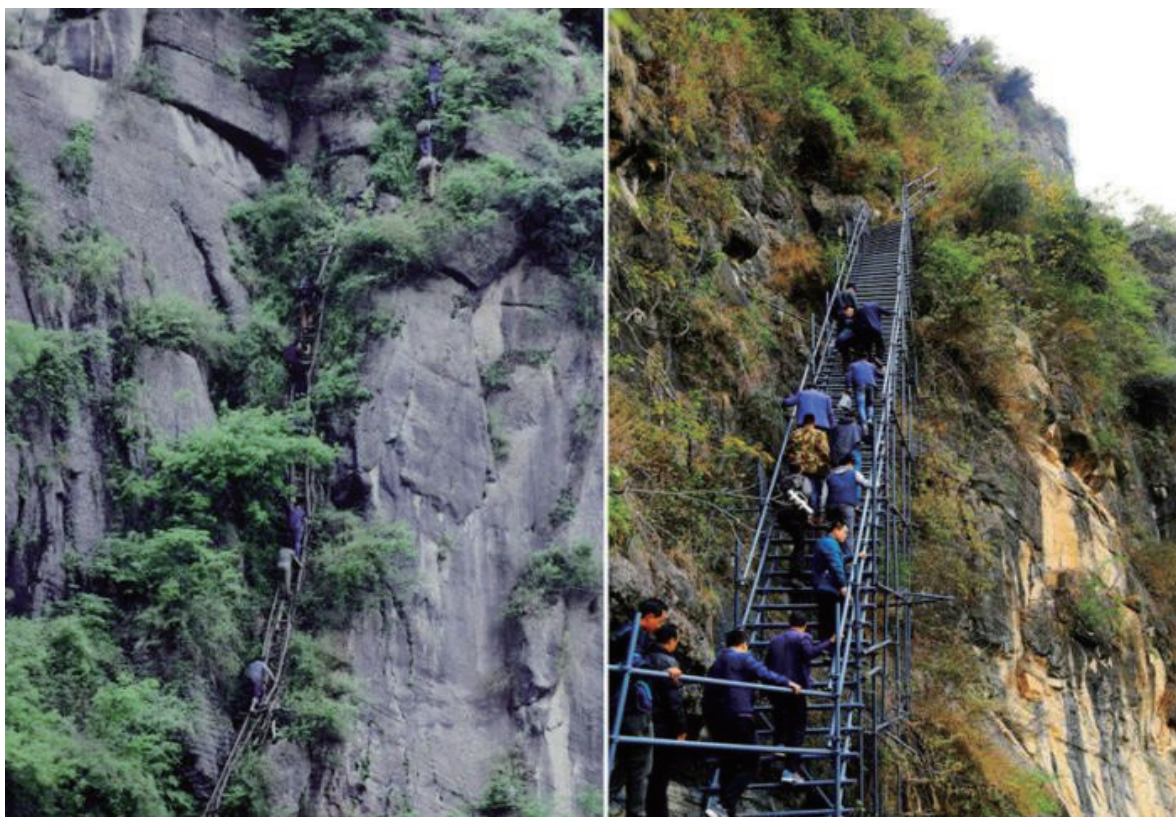
2022年全国两会期间，益西达瓦委员向习近平总书记展示的两张照片。