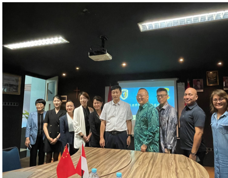
参会人员集体合影留念