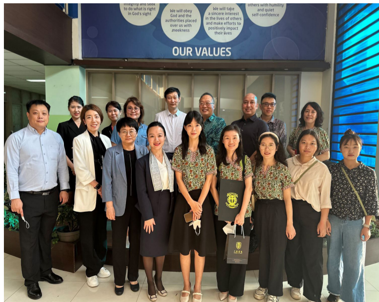
参会人员集体合影留念