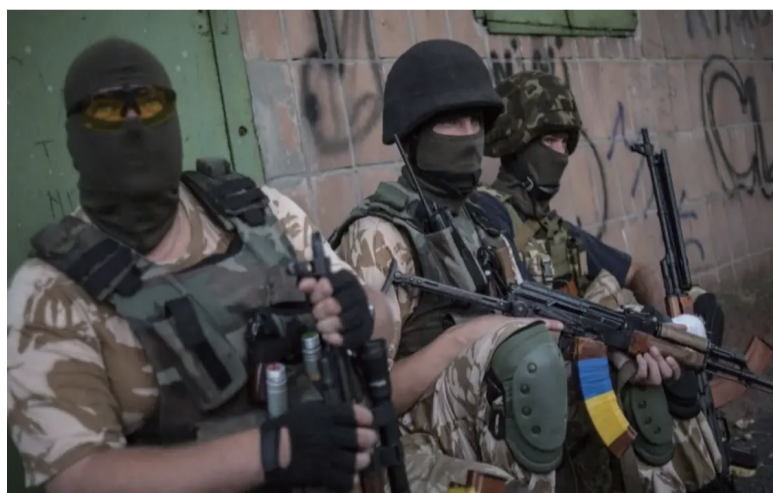
未来身着乌克兰军服的特种部队可能会在俄境内制造一些“大事件”