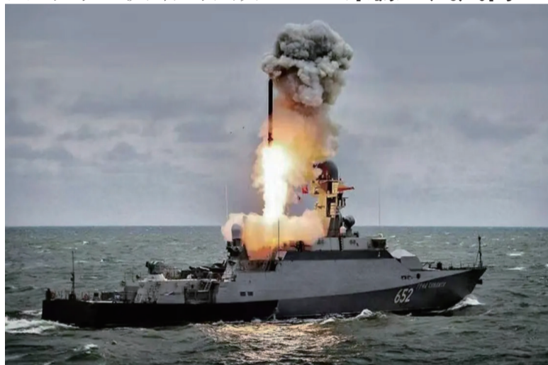
在俄军现阶段的战术核威慑体系中，舰载核武的地位越来越重要。