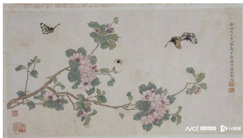
资料图：清胡楷花蝶图