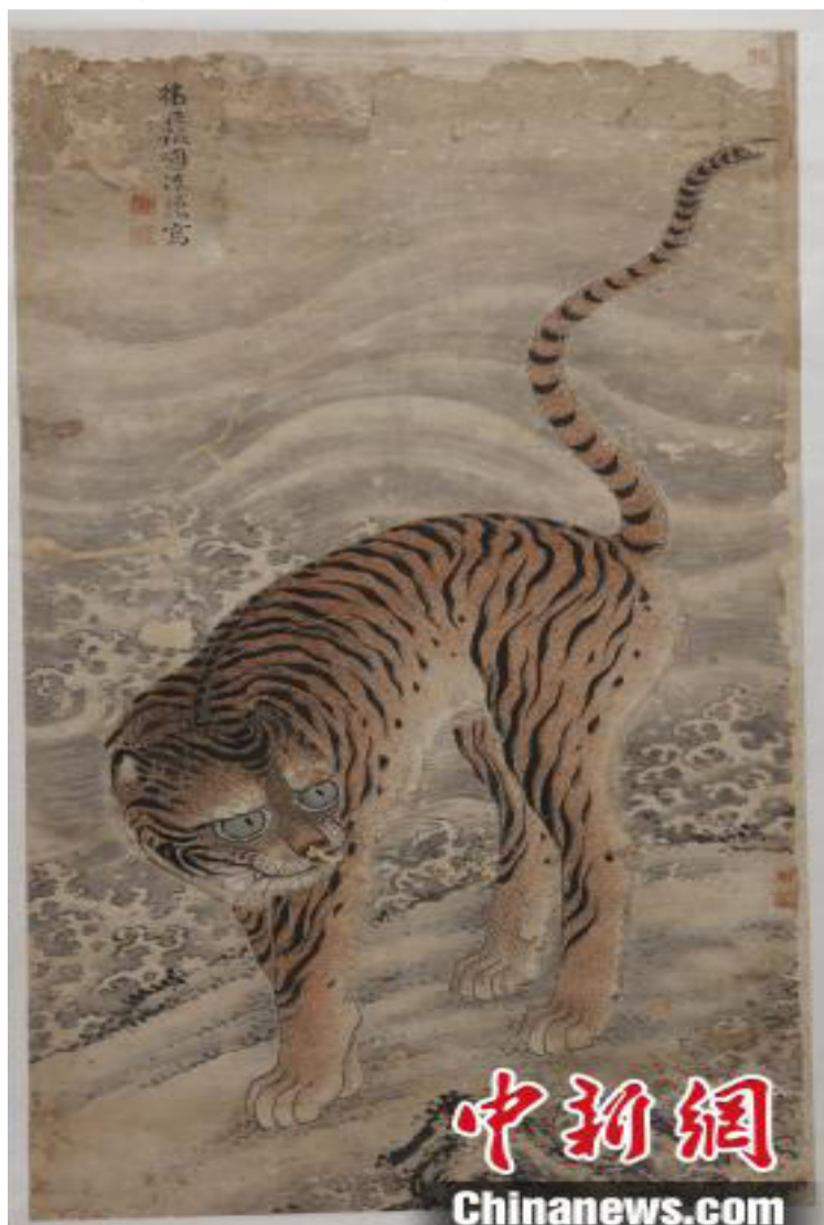
陈琼《招财虎图》