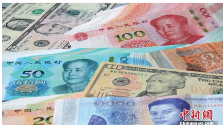
人民币与美元等货币图片。