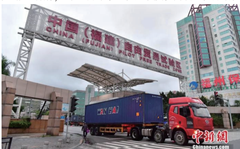
货柜车驶出福建自贸区福州片区。

品，所以在积极参与国际分工的同时，绝不能放弃此类产品的生产。第二，关键核心技术是具有溢价权的垄断性技术。为避免受制于人，必须坚持科技自立自强。关键核心技术包括基础性技术、撒手锏技术、颠覆性技术，三者同等重要。尤其要在颠覆性技术领域超前部署，重点突破。发挥中国的新型举国体制优势，在某项颠覆性技术上领先一招，方能扭转被“卡”局面。(完)