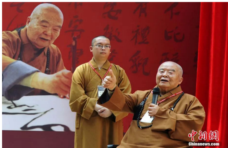
资料图：星云大师。