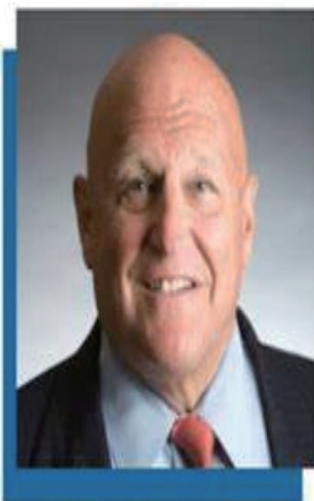
Richard L. Armitage CSIS Counselor