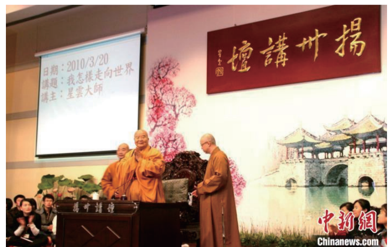
2010年3月20日星云在家乡首讲，畅谈他是怎样从扬州走向世界。（资料图）