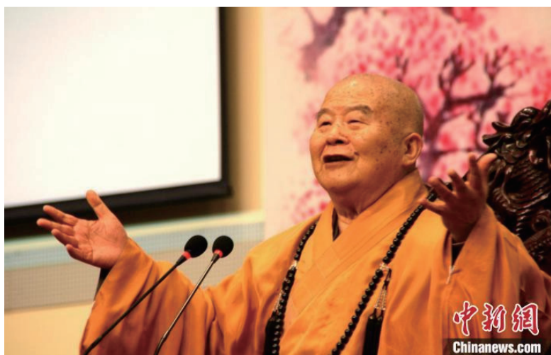
追忆星云大师：“我想不出比古人更好的词语赞美我的家乡。” (资料图)

“星云大师把自己的心力倾注在公益事业、大众事业中，把一粒粒‘三好’‘四给’‘五和’的善缘种子播撒在五大洲。”一位扬州市民说。（完）