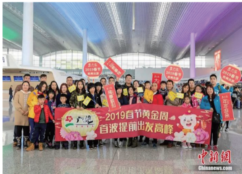
中国民众春节出境游团体。

过去三年来，新冠疫情对各国商贸合作及文化交流带来深刻变化，中国也深受影响。但随着中国疫情管控措施持续优化，中国与世界的连接正在迅速恢复。中国春节经济再次吸引世界目光，为全球提供共享喜乐与繁荣的机会。(完)