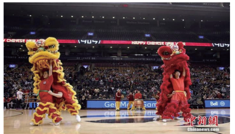
2018年2月，春节期间，美国职篮发展联盟球队在加拿大多伦多举行中国新年特别赛事。图为比赛间隙，场内表演舞狮。余瑞冬 摄