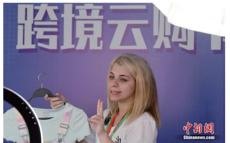
跨境电商带货直播。