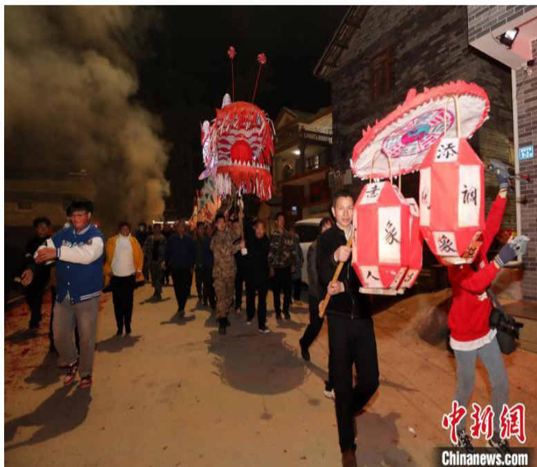
游龙队伍前后各有迪坑锣鼓一班，喜庆的节日氛围在整个村庄蔓延。