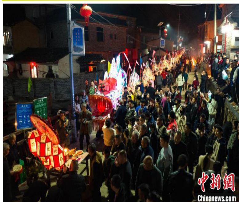
乡亲们簇拥着威武大龙巡游在乡村街巷、田间地头，庆祝元宵佳节。