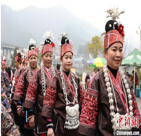
萌娃闹新春