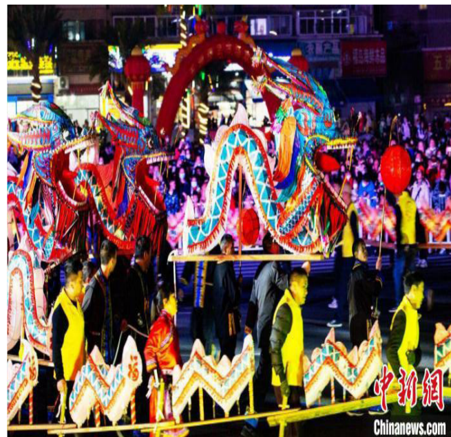
踩街队伍