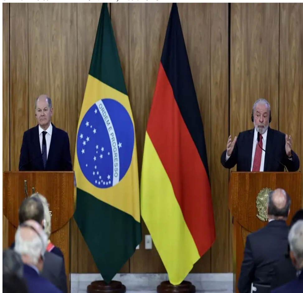
朔尔茨和卢拉出席联合记者会