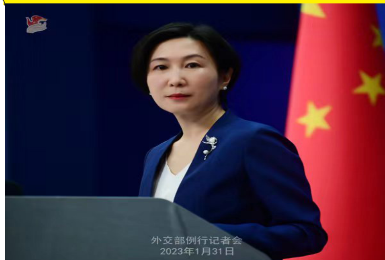
外交部例行记者会 2023年1月31日