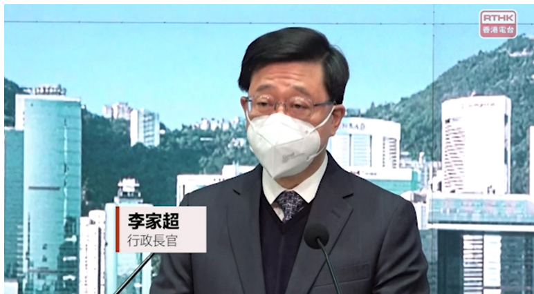
李家超:有信心很快全面通关,将有好消息包括取消核检