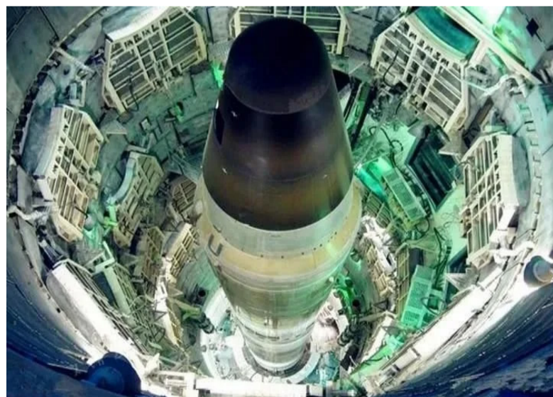
美国“民兵-3”洲际导弹发射井