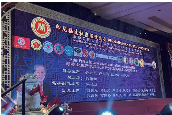
印尼福建社团联谊总会第四届理监事名单