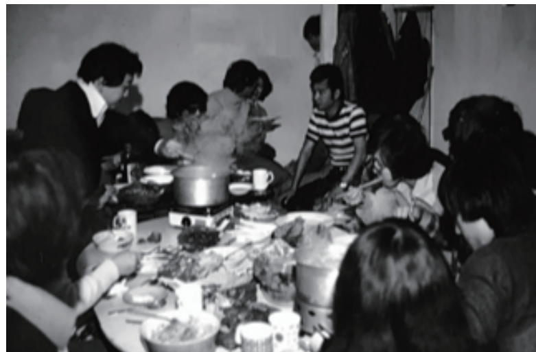
离乡背井的留学生，一人一道菜，在异地共度除夕夜