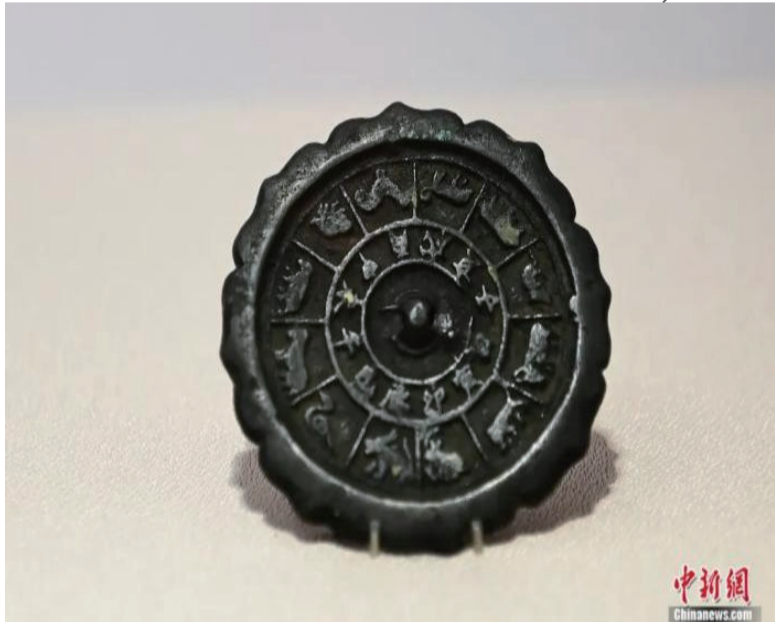
四川博物院藏“十二生肖时辰铜镜”。

十二生肖和古代先民的动物崇拜心理有关。有的动物进入十二生肖，体现的是力量崇拜，比如老虎是勇敢、有力量的山中之王。在中华文化语境中，老虎的身上寄托着人们受到庇护、躲过灾难和侵害的愿望，而同样作为猛兽的豺狼则缺乏这样的文化语境；有的动物进入十二生肖，更多与人们的生活诉求有紧密联系，比如老鼠生育能力强、活动精力旺盛，借助对其生命力的崇拜，人类希望家庭人丁更加兴旺；龙作为传说中的“神兽”被列入十