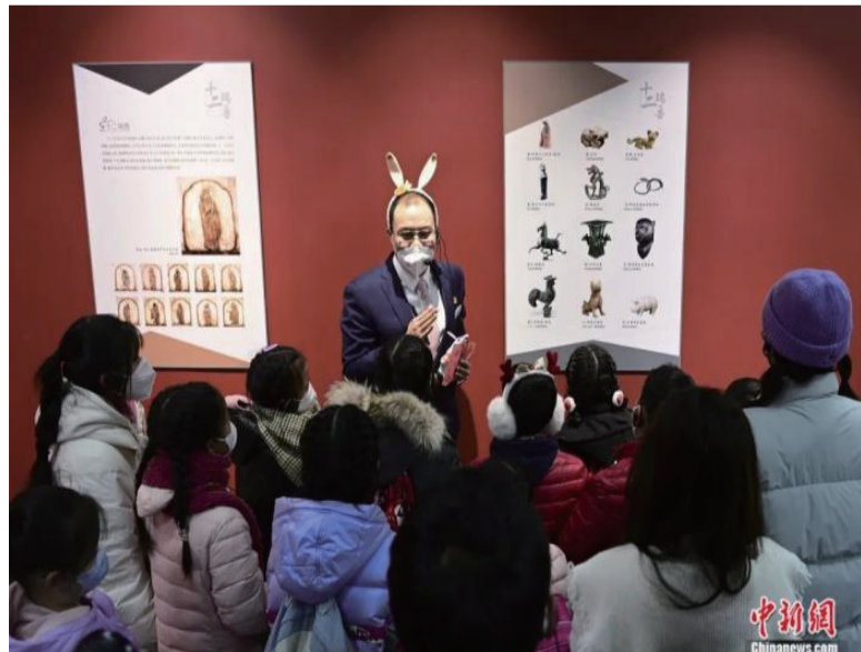
1月14日，北京自然博物馆工作人员为小朋友们讲解十二生肖知识。