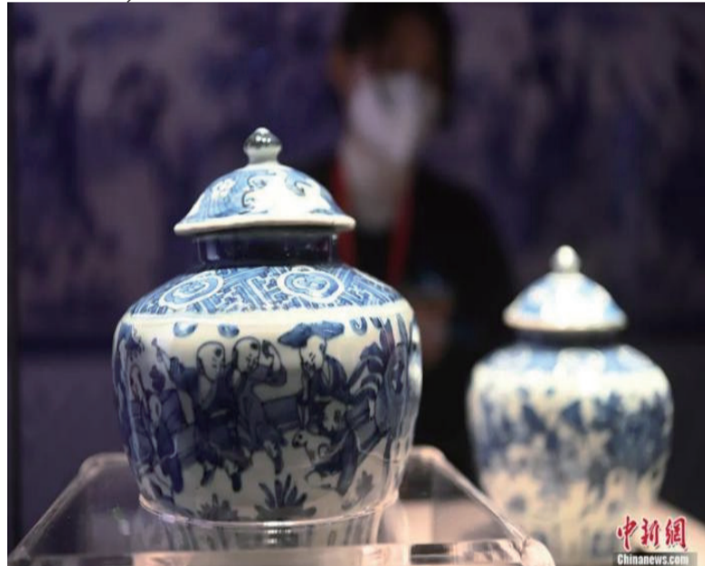
四川博物院藏“青花童子白兔盖罐”。