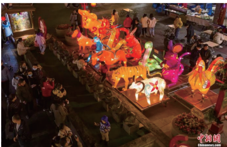
2021年2月，山西太原食品街，十二生肖造型的花灯吸引游客驻足欣赏。

中国有关生肖的文字记载在《诗经》中就已出现。作为一部诗歌总集，《诗经》反映了西周初至春秋社会生活的方方面面，记录与先民生产生活密切相关的各类物象，生肖便是其中一类，反映出先民的思维特征。比如《诗经》中《小雅·吉日》篇说“吉日庚午，既差我马”。其中“庚午”对应“马”，这与流传至今的十二生肖“午马”一致。