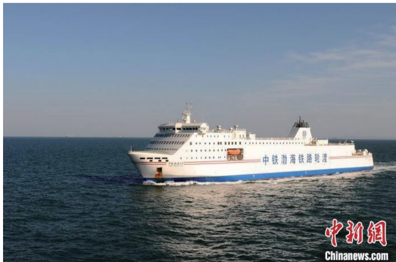
图为轮渡行驶在渤海湾。