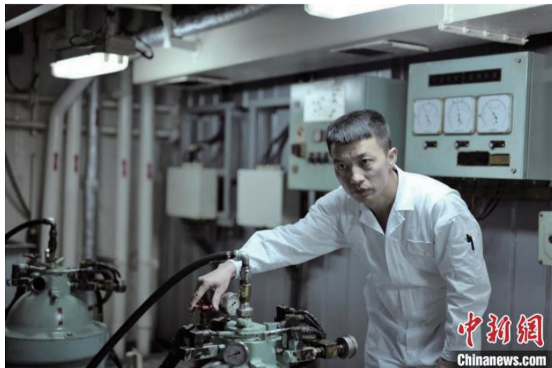
机舱工作人员在工作。