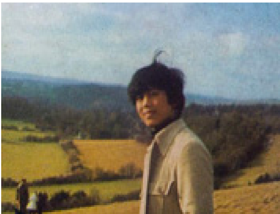
原野，渐由翠绿转为遍地金黄