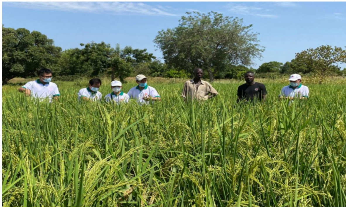
这是2021年7月13日，中国专家组成员在布基纳法索中西大区水稻示范区查看苗情。