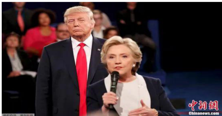
资料图：当地时间2016年10月9日，华盛顿大学，特朗普与希拉里参加总统大选辩论。