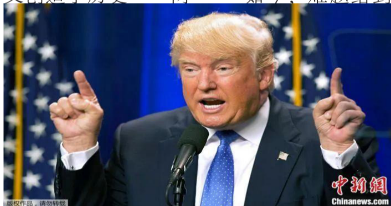
资料图：美国前总统特朗普。