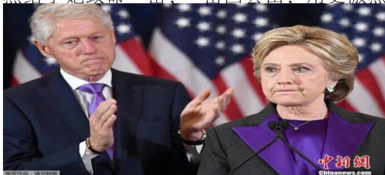
资料图：当地时间2016年11月9日，美国纽约，民主党总统候选人希拉里在丈夫、前总统克林顿陪同下，发表败选演讲。