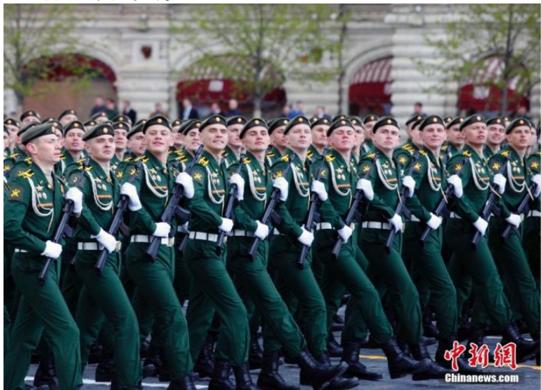
资料图：当地时间2022年5月9日，俄罗斯在首都莫斯科红场举行纪念伟大卫国战争胜利77周年阅兵式。共有1.1万名军人、131件现代化武器和军事技术装备在红场接受了检阅。