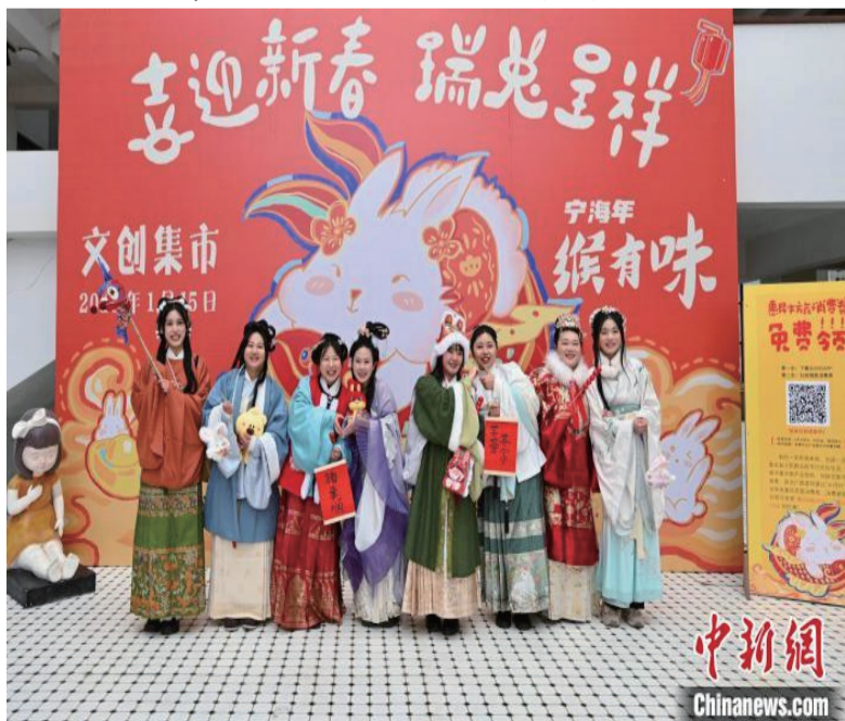
文创集市游园活动现场