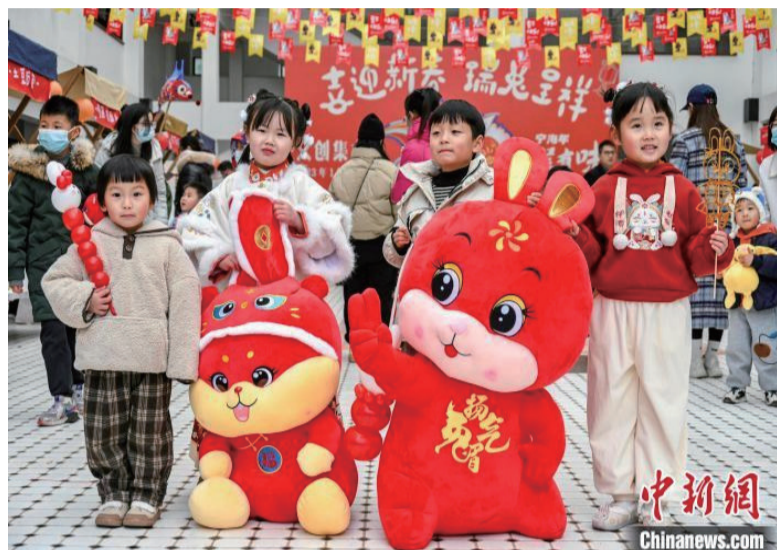
孩子们参与“非遗过大年”活动

“年轻人给‘赶集’赋予了新定义,沉浸式的文创体验,配上精致美食、网红甜品、趣味活动,正契合了年轻群体既要传统回归又有创新延伸的新消费观。”宁海县文广旅游局局长张畅芳告诉记者,宁海推出“我在宁海过大年——宁海年·猴有味”迎春民俗文化系列活动,包括“游自在宁海、品年味民俗、享文化惠民、抢文旅红包”等四大板块,提供一种全新的城市生活方式,在商品交易之外,体验文化消费,让更多年轻人爱上“赶集”,激发城市消费新活力。(完)