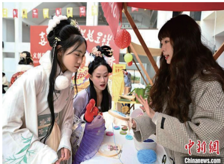
游客逛非遗集市