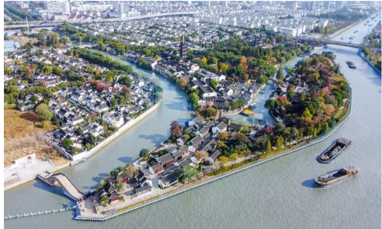
当今的苏州大运河