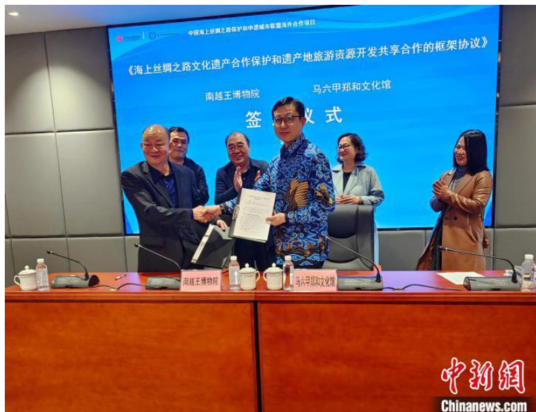
签约仪式