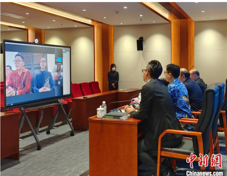
视频连线