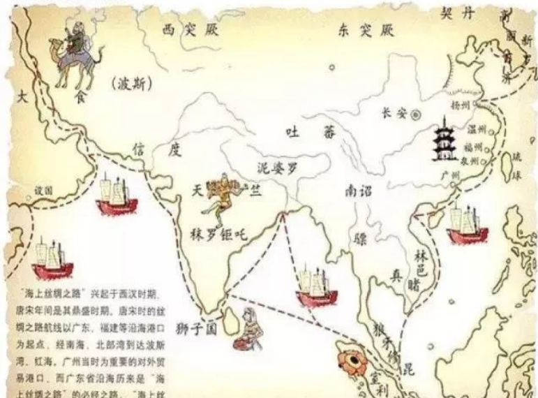
唐宋时期海上丝绸之路示意图