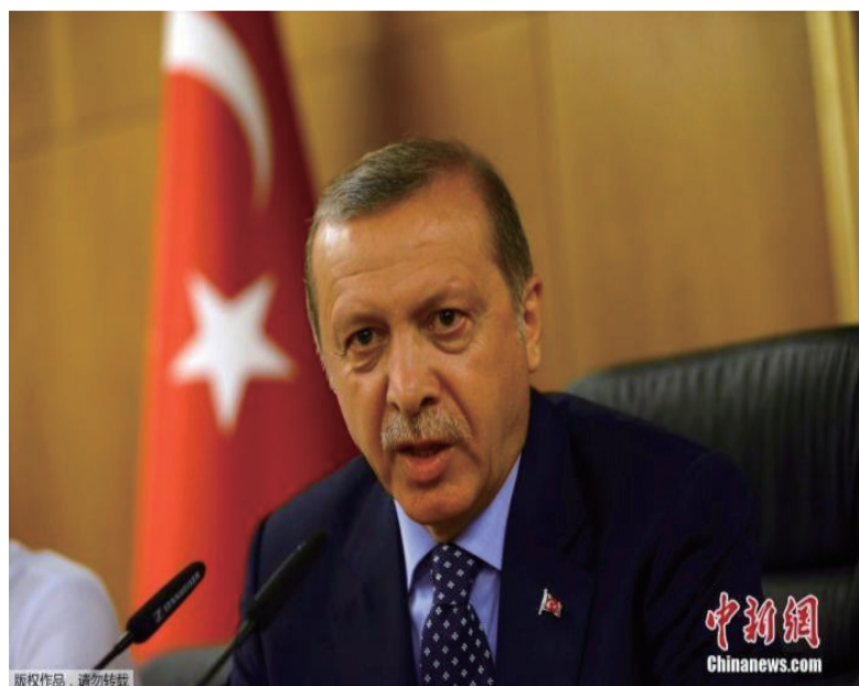
资料图：土耳其总统埃尔多安。