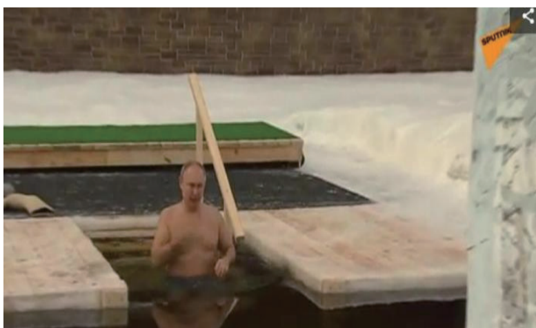
当地时间2021年1月19日，俄罗斯东正教主显节，俄总统普京按习俗步入冰水池中浸洗。