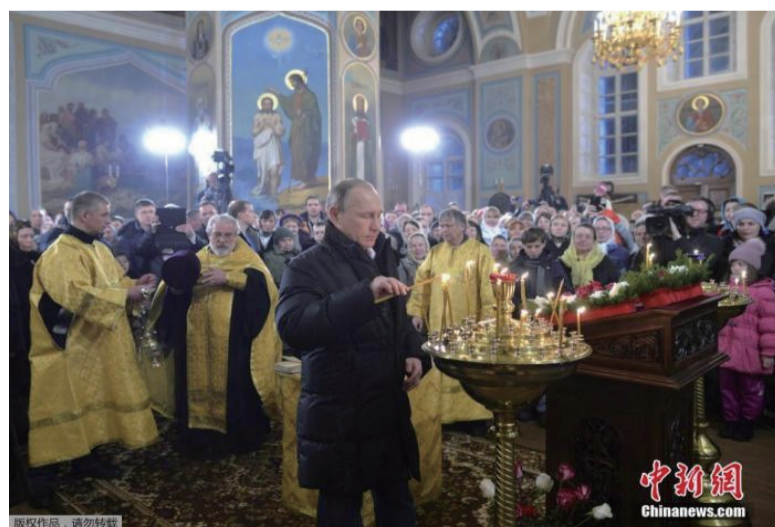
资料图：俄总统普京出席东正教圣诞庆祝仪式，每年1月7日是东正教圣诞节。