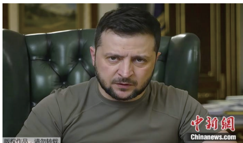
泽连斯基：没必要