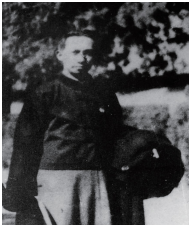
1925年，吴玉章在北京加入中国共产党