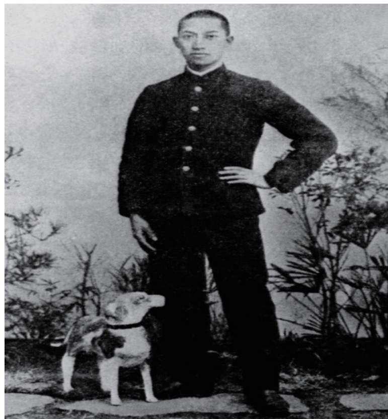
1904年，吴玉章在日本东京