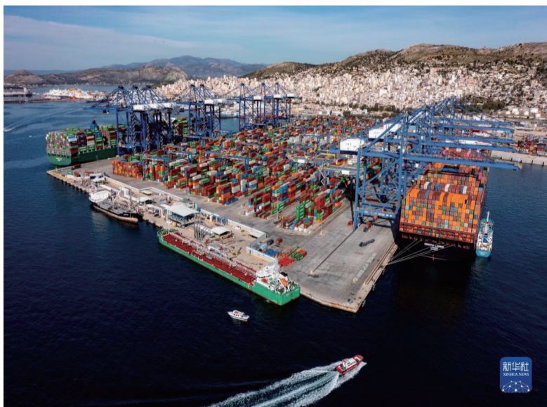
这是希腊比雷埃夫斯港集装箱3号码头（2022年2月19日摄）。

既以为人，己愈有；既以与人，己愈多。中国式现代化大道越走越宽，拓展了发展中国家走向现代化的途径，深刻改写了世界历史进程，为人类和平与发展事业贡献了中国智慧、中国方案。埃塞俄比亚学者贝尔胡特斯法说，中国式现代化“鼓舞世界”，对其他发展中国家寻找适合