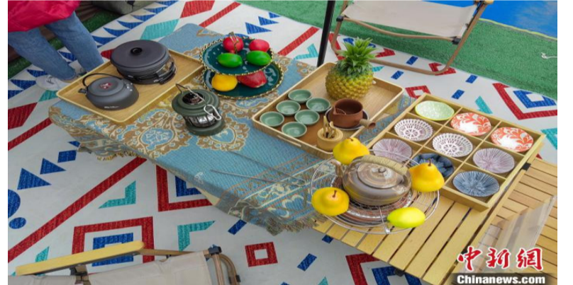
图为正在展示的露营用品。刘俊聪 摄