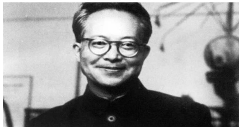
沈从文。中国著名作家、历史文物研究者