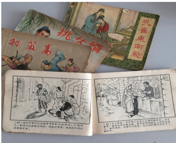
还记得这种小人书吗？七八十年代，出租“小人书”连环图的小摊处处皆是