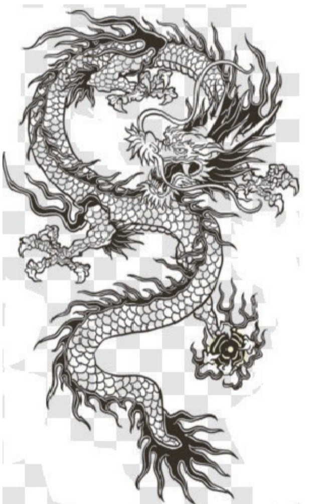
龙是中华民族的象征,代表吉祥、诚信与华贵