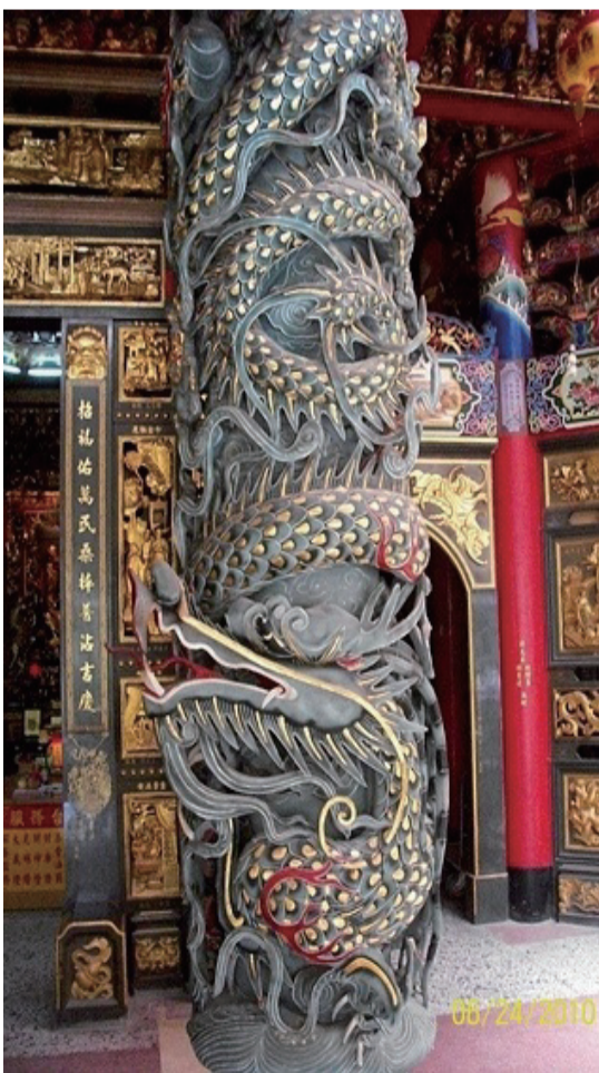
二舅看到彩云中，钻出一条像庙宇缠绕圆柱的金龙！