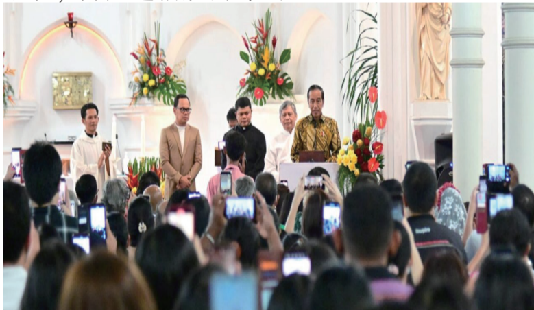
佐科总统走访茂物教堂

伊斯兰祈祷团”曾从马来西亚柔佛潜入印尼多地，进行恐怖袭击，造成严重伤亡。警方吸取这严峻教训，每年圣诞都加强防备，确保安全，有力地促进了多元宗教文化交流发展，成为世界宗教和谐、多元文化发展的模范国家。（李全）