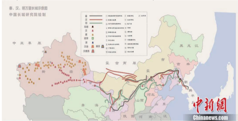
秦、汉、明万里长城示意图。中国长城研究院绘制