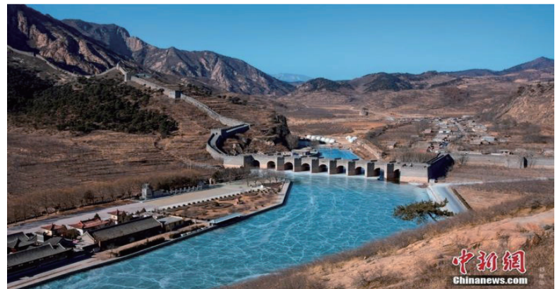
水上长城，辽宁省绥中县九门口长城。