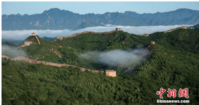
长城与支墙、烽燧，河北省滦平县金山岭长城。