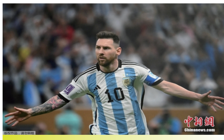
北京时间12月18日，2022卡塔尔世界杯决赛，阿根廷队对阵法国队的比赛正式打响。图为梅西庆祝进球。