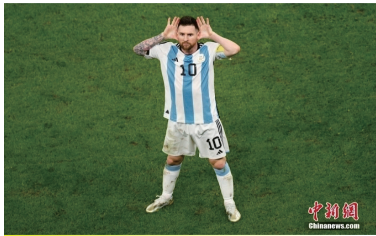
进球后，梅西模仿里克尔梅的庆祝动作，致敬偶像。