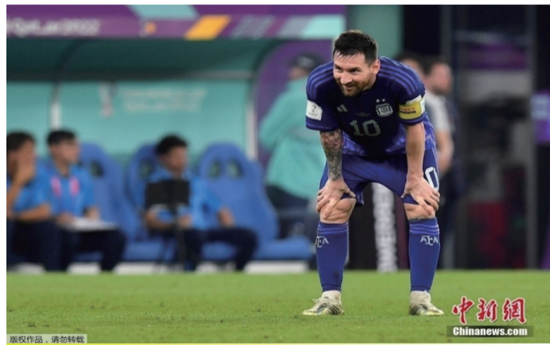
小组赛三轮过后，阿根廷队，两胜一负积6分，以小组第一晋级16强。