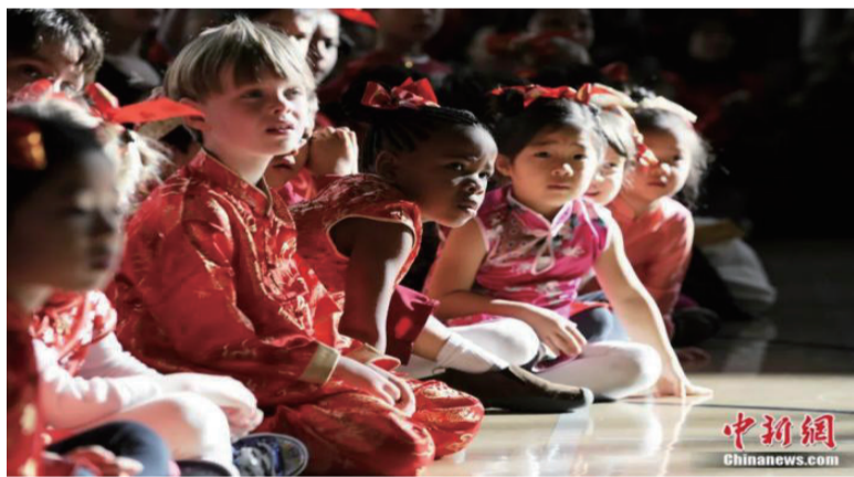
图片美国旧金山中美国际学校的学生穿中式服装表演节目庆祝中国农历新年。当地华人比例为全美最高。

另外，圣迭戈加州大学的博雅教育理念对我在香港科大的工作也有启发。当时，港英政府只允许我们办理学院、工学院和商学院，但我坚持同时要办人文与社会科学学院。我还希望每个学生主动参加