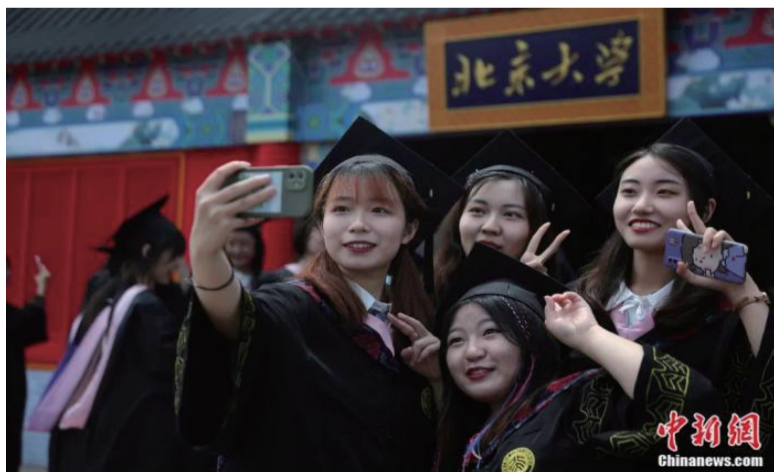
北京大学2021届本科毕业生在校名前拍照留念。蒋启明 摄